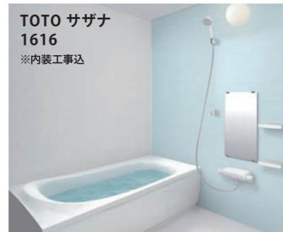
TOTO サザナ 1616 ※内装工事込

ファーストプラスI型2550/仕様:オールスライド収納タイプ リムレンジフード、食洗器、浄水器一体型シャワー水栓、片面焼 きガスコンロ、キッチンパネル施工、吊り戸無し