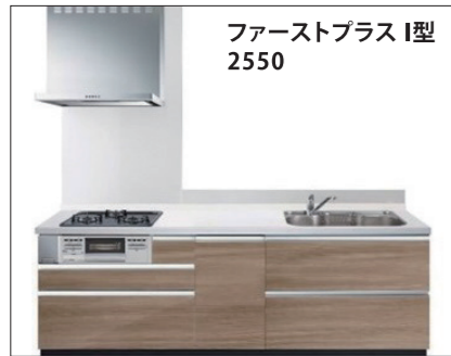
ファーストプラス I型 2550