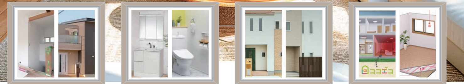
増改築・全面Reform 水まわりReform 外装Maintenance 断熱Reform