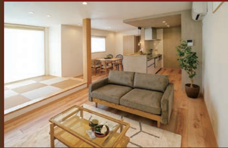
間取り変更プラン