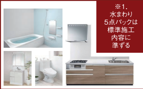
水まわり5点プラン