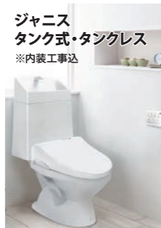
ジャニス タンク式・タンクレス ※内装工事込

TOTOサザナオリジナル仕様 HT 5タイプ 1616/仕様:カラ リ床、ゆるり浴槽、魔法びん浴槽、お掃除ラクラクカウン ター、折り戸、平天井(抗菌・防カビ仕様)、断熱材パック