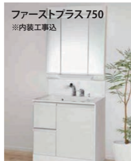
ファーストプラス 750 ※内装工事込

TOTO:CFS367ウォッシュレットBV1 /仕様:フチなし形状、節水タイプ、 棚付き2連紙巻器、タオルリング