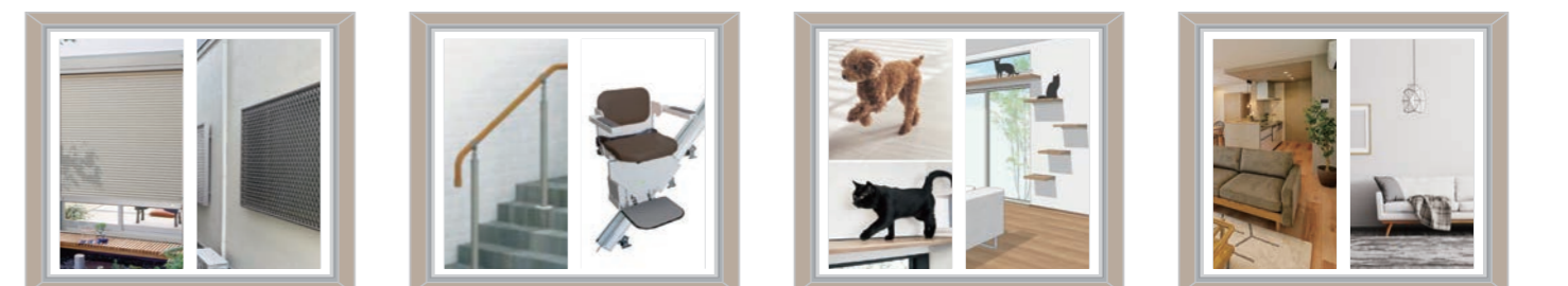
防犯・防災Reform バリアフリーReform ペットReform KURASHI UPリノベーション