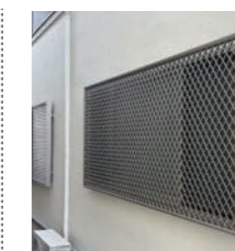
面格子 防犯ピッチ仕様 サイズ:0709